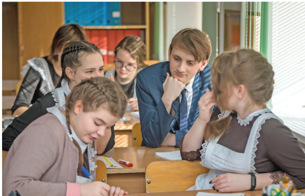
Урок обществознания в 10-м «Б» классе

Ольга МУШТАЕВА » ТЕКСТ, Павел КОЛЯДИН » ФОТО